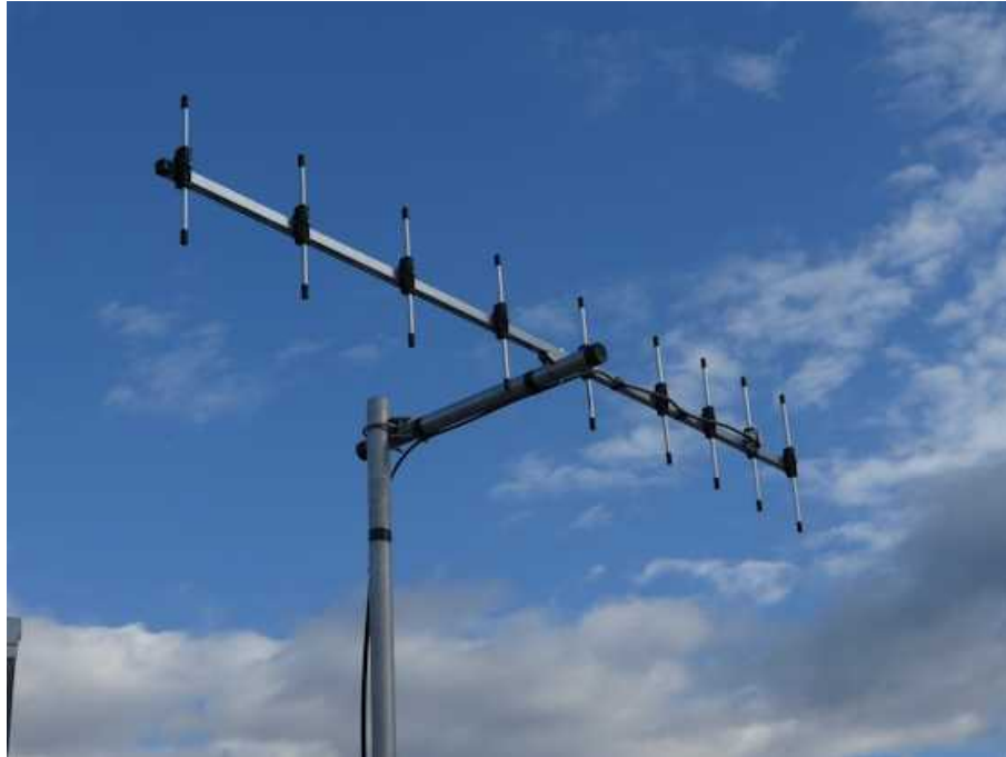
写真はサブブームセットと組み合わせた物です。

SSシリーズのアンテナに比べると少しナローズペースで、作りも少し華奢になっています。